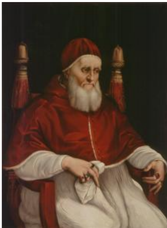
Papa Celestino al II-lea

La 29 ianuarie 1139, același Inocențiu al II-lea avea să promulge “privilegiul pontific” 5 . numit “Omne datum optimum” , prin care Sfantul Scaun acorda concesiile majore Templierilor, printre care și acela de autonomie totală în fața diverselor ierarhii laice și ecleziastice, incluzându-l aici inclusiv pe Patriarhul Ierusalimului, Ordinul urmând să se supună exclusiv autorității Papei. În același timp Ordinul a fost scutit de la plata zeciuiei, iar pentru a nu se amesteca cu “gloate de bărbați și mulți de femei” atunci când mergeau la biserică, li s-a oferit privilegiul de a-și deschide propriile oratorii pentru slujbele religioase, cât și pentru oficierea slujbelor de înmormântare ale tuturor membrilor cofreției.