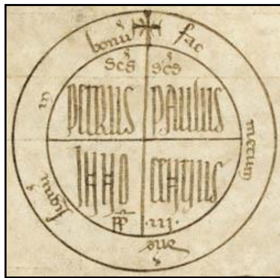
Parafa lui Inocentiu al II-lea (1198-1216)