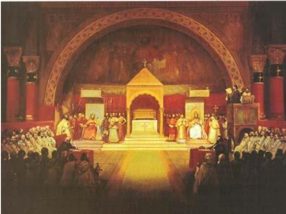
Capitul General Templier, tinut la Paris in 1147

Celelalte acte pontifice, desi fiecare cu insemnatatea lui, au intarit cele decise prin privilegiul " Omne datum optimum ", adaugand cate ceva de o importanta mai mica sau mai mare. Mai jos veti gasi textul original in limba latina al privilegiului si apoi o traducere libera facuta de autorul acestei lucrari.